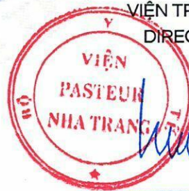
Đỗ Thái Hùng