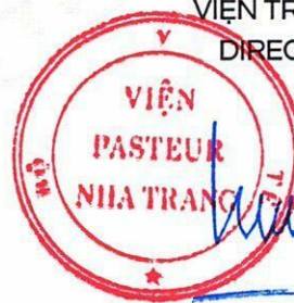
Đỗ Thái Hùng