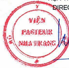
Đỗ Thái Hùng