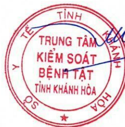
Tôn Thất Toàn